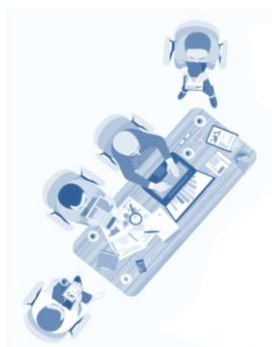
Comité de pilotage

Christelle Jeannet Experte 06 22 72 82 20